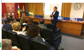
LA PRÓSTATA SÍ IMPORTA LLEGA A LA RIOJA PÁGINA 2