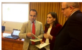
BOTICARIA GARCÍA, EN EL COLEGIO PÁGINA 2