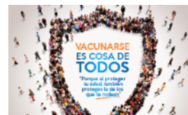
VACUNACIÓN CONTRA LA GRIPE PÁGINA 4