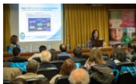
I JORNADA CONECTA EN LA RIOJA PÁGINA 3